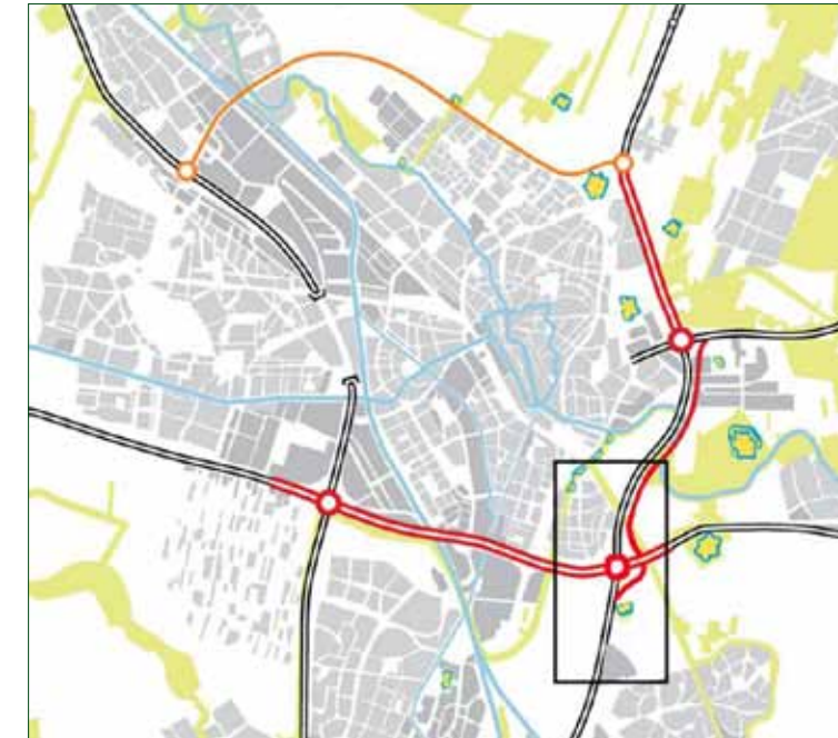
Figuur 3.3 Alternatief Oost 1c – sorteren voor de knooppunten

In deze oostelijke variant wordt de grote verkeersstroom A27-A28 al vóór de knooppunten Lunetten en Rijnsweerd gescheiden van de overige verkeersstromen. Dit gebeurt via een aparte bypass die langs de beide knooppunten loopt, en bij Amelisweerd door de Bak wordt geleid. De bypass heeft geen afslagen en wordt zo strak mogelijk met de bestaande A27 gebundeld. Fort het Hemeltje wordt gespaard. De Bak zelf wordt verbreed om plaats te kunnen bieden aan 2x5 rijstroken met daarnaast een bundel van 2x2 rijstroken (5-5-2-2) en een maximum snelheid van 100 km/u. In totaal zijn dit zeven rijstroken per rijrichting.